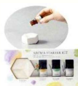
アロマストーンセット